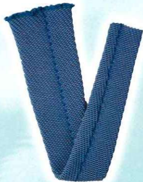
ショート丈 置き寸 76-78cm