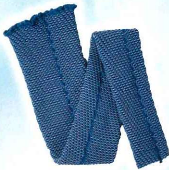
ノーマル丈 置き寸 89-91cm