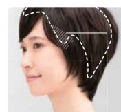
安心フィットのもみあげ