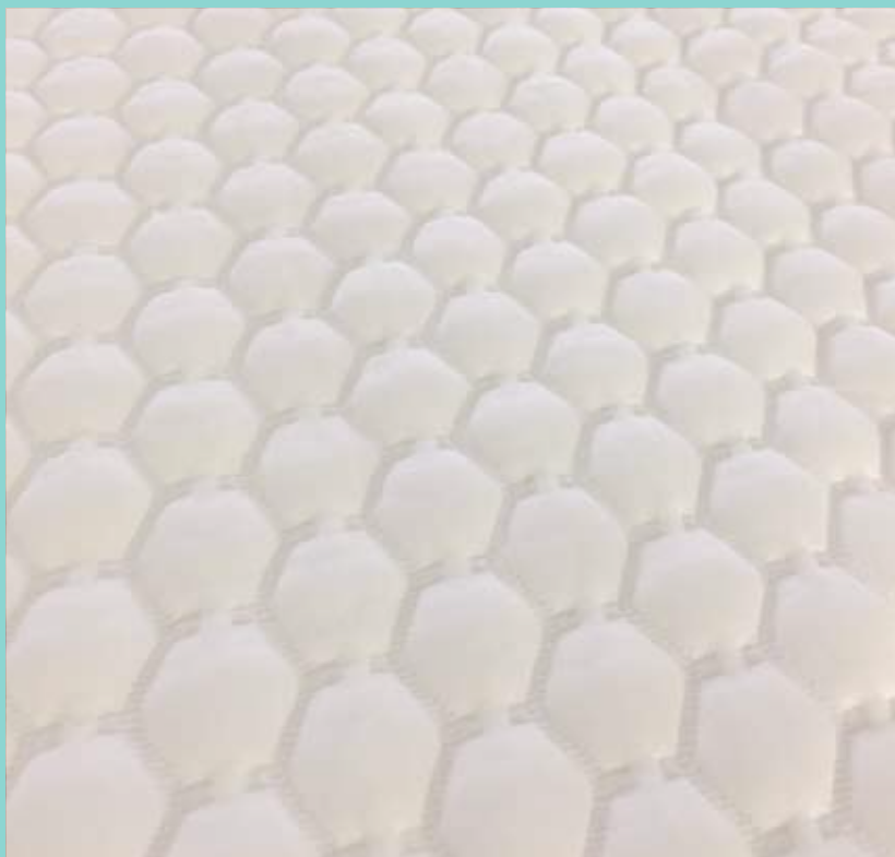
*表面拡大写真。より光沢のある凸面を使用部位にあててお使いください。