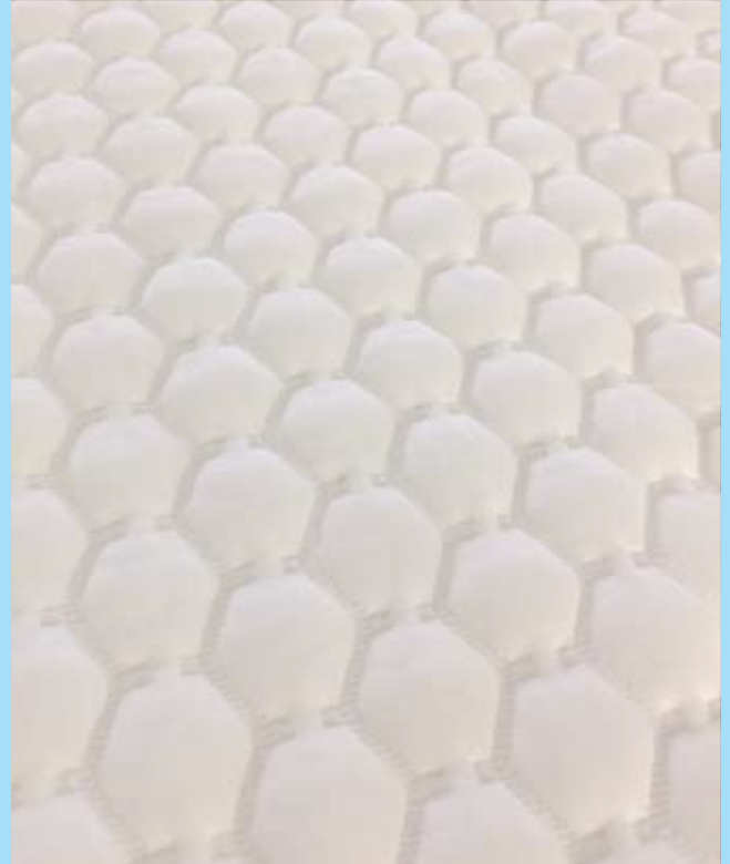
*表面拡大写真。より光沢のある凸面を使用部位にあててお使いください。